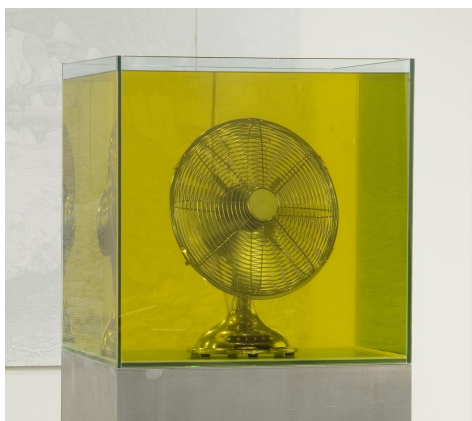
Eric Baudart, Atmosphère I , 2011