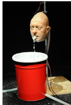
Nathaniel Mellors, The Object (Vomitor) , 2010 Courtesy de l'artiste ; Matt's Gallery, Londres ; Monitor, Rome ; Stigter van Doesburg, Amsterdam